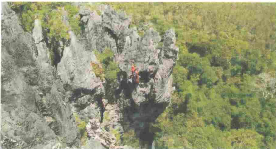
Après une deuxième édition sur le thème des «grandes voies» (notre photo), la troisième édition du festival Roc and roches est prévue cette année sur le thème de l'escalade sur blocs.

Les membres de Vertikaledonie se sont investis dans la préparation du festival "Roc and roches" comme ils le font également lors des journées découverte organisées par le club pour promouvoir leur activité. Des journées organisées une à deux fois par an qui sont toujours très conviviales. On y vient en famille pour découvrir les voies des Roches Notre Dame.