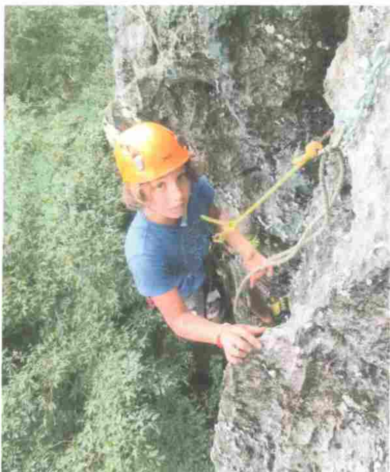
Accessible à partir de 7 ans, l'escalade est un sport complet qui apprend à se dépasser tout en gardant la maîtrise de ses actes.

notamment le projet de rééquiper les voies des grottes, qui ne sont pas toujours aux normes." Mettre en place de nouveaux sites d'escalade en province Nord dans d'autres communes est également l'un des objectifs, mais la mission ne semble pas très simple. "Nous avons ouvert un nouveau site "de blocs", qui accueillera le prochain Roc and roches." Le "bloc" est un style d'escalade qui se pratique sans équipement sur des surfaces qui ne dépassent pas quelques mètres. Le grimpeur recherche la difficulté d'un mouvement ou d'une séquence courte de mouvements.