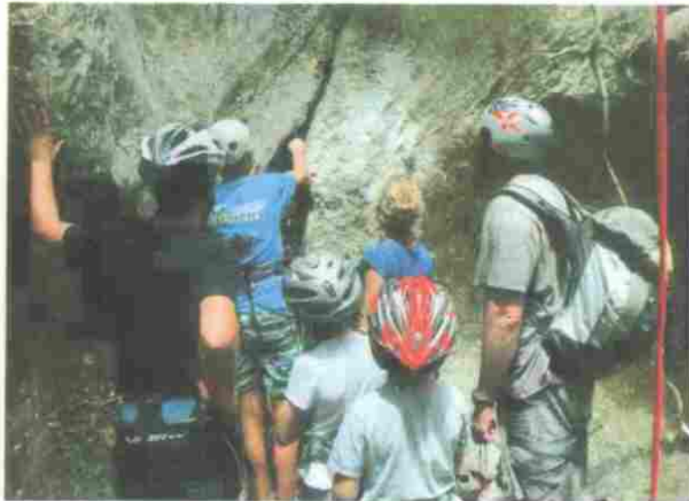
Organisé avec le Comité régional de montagne et d'escalade, le festival Roc and roches a connu un grand succès dès la première édition.

ces manifestations ont permis de faire connaître le site. "On peut dire qu'il y a un tourisme qui s'est développé autour de l'escalade à Koumac. Il y a quatre ou cinq ans, nous étions seuls sur les sites de grimpe. Maintenant, pendant les longs week-ends, on rencontre