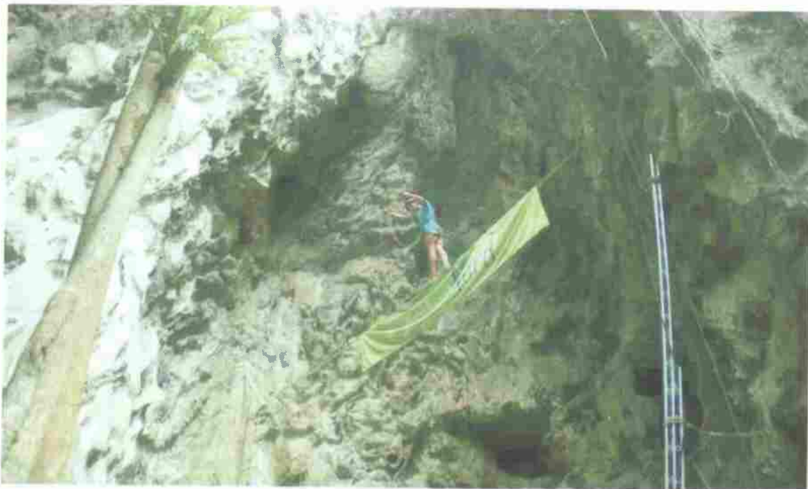
Le festival Roc and roches organisé pour la première fois en 2012 a fait découvrir les sites de Koumac aux amateurs de grimpe.

Vertikalédonie compte à ce jour une cinquantaine de licenciés, dont huit personnes très impliquées dans le fonctionnement de l'association.